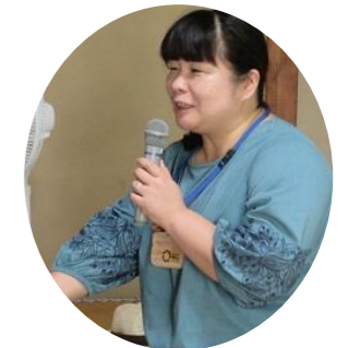
講師：豊田市郷土資料館