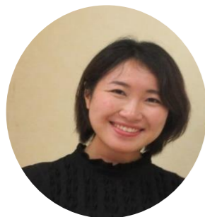
講師：ひまわりネットワークアナウンサー

話し方の5つのポイントを学んだ後で、いつもよりワンランク上の自己紹介をしました。後半は講師による「よだかの星」の朗読。美しい日本語と、物語の切なさに心打たれました。