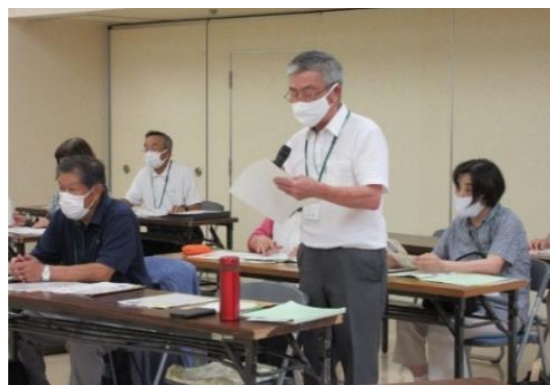
1班班長によるはじめの挨拶