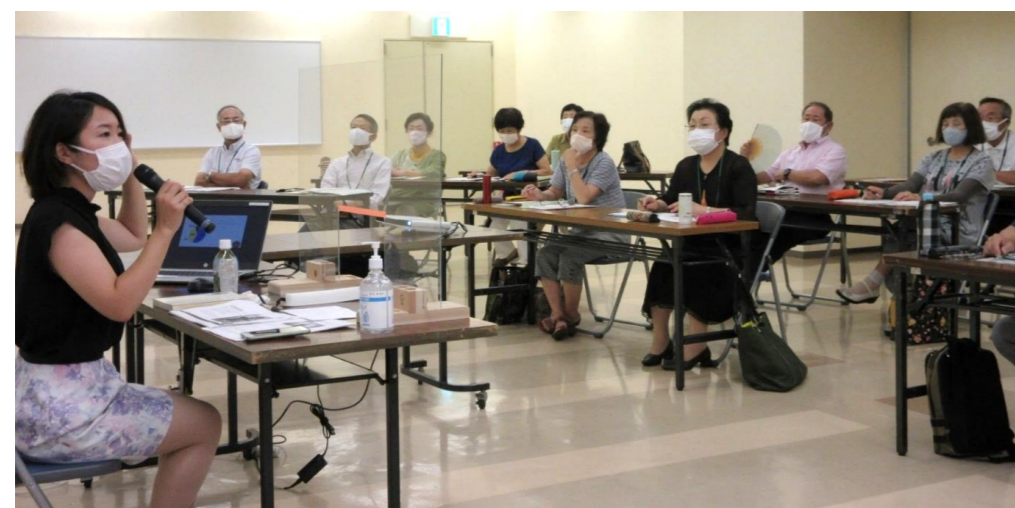
大きく口を開けてカツゼツ体操、「あ・え・い・う・え・お・あ・お〜」