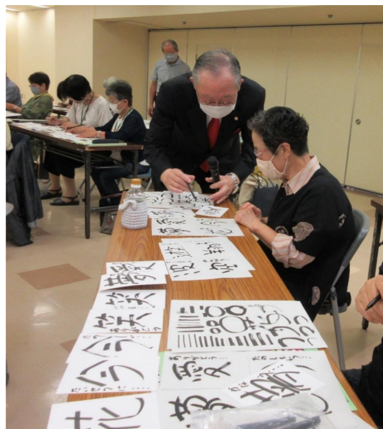
縦の線、横の線から始まって大きい漢字と小さいひらがな…いっぱい練習して一気に上達！