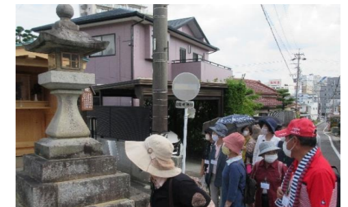
神明街道を通過して、神明社へ。途中の常夜灯は、かつて主要道であったことを今に残しています