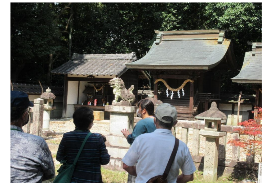
神明社の解説を聞きます